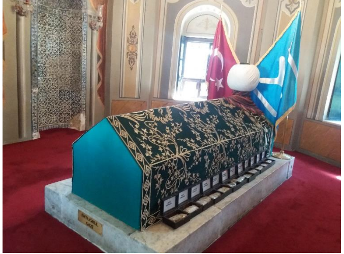
[Ertuğrul Gazi türbesi]

Söğüt'e yakın muhkem konik bir tepede türbesi bulunan Dursun Fakih, Osmanlı Devleti'nin kuruluşunu dinî olarak ilk defa tescilleyen büyük bir Türk Bilginidir. Onun türbesinin bulunduğu muhit, hemen bütün ovaya/obaya hakim bir tepede, ezan ve tekbir sesleri ile bütün cihanı dolduracakmış gibi bir duruş sergiler. Onun bu hali bana, biraz ileride İznik'te yüksek bir tepede medfun bulunan Abdulvahap Sancaktarı'yi hatırlatır. Onlar bu haliyle adeta, vefatları sonrası bile bu yurdun gözcüsü, bekçisi olarak 'ben hep buradayım!' demektedirler. Dursun Fakih, (miladi) 28 Eylül 1299'da irad ettiği hutbesinin sonunda "Ya Rabb'el-Âlemîn! Osman Gazi Han'ın hanlığını ve sultanlığını mübarek eyle. Amin, amin, amin." diyerek Osmanlı'nın kuruluşunu ilan etmiştir. Söğüt coğrafyası dört mevsimin yaşandığı, Karadeniz-Marmara-İç Anadolu ikliminin aynı anda kendini gösterdiği, pekçok ürünün yetiştiği, yerine göre dağlık-taşlık, yerine göre mümbit arazilerin yer aldığı bir muhit. Bu durum, Türk ruhuna ne çok uygun düşer.