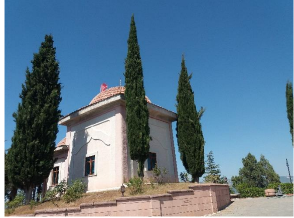
[Dursun Fakih türbesi]