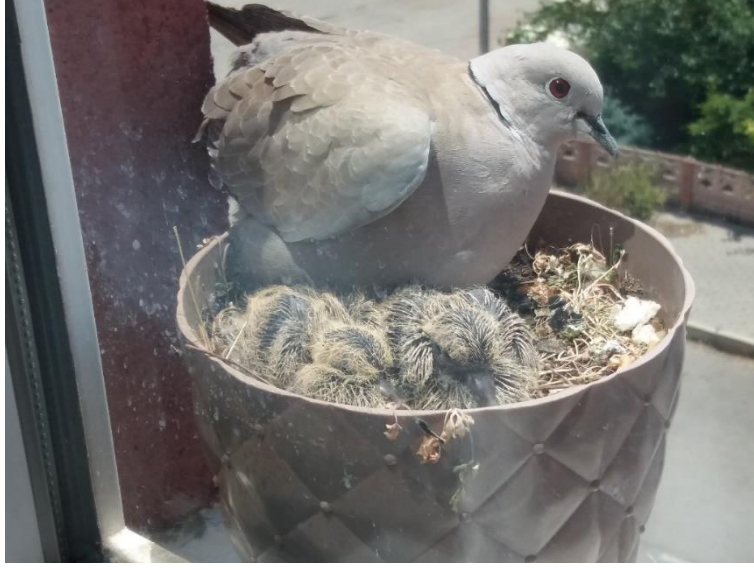
Penceremde Kumru Kuşu

İçinde yaşadığımız tabiatta hayvanların kendilerine mahsus bir dünyası vardır. Kuşlar, bu açıdan dikkate değer canlılardır. Her birinin yaşam biçimi farklılık arzeder. Bunlardan bazıları tabiatın kucağında, bazıları evcilleşmiş haliyle insanlarla varlığını idame ettirir. Bir kısmı evcilleşmiş olmadığı halde insanlara yakın durur. Kumru kuşları bu üçüncü kategoride yer alır.