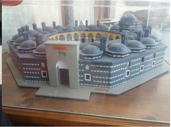
[Büyükağa Medresesi maketi]

Sabuncuoğlu Şerefeddin'in (v. 1470) bir tabip olarak burada ayrı bir yeri var. Bimarhane'nin taç kapısı, eski Selçuklu ilmi yapılarının bir benzeridir. Bu yapı, Sivas Gökmedrese'de ve daha birçoklarında görülür. İlme hürmetin nişanesi olarak o manzara karşısında kişi, adeta büyülenir kalır. Bir dünya görüşünün, taş kesilmiş kitap olarak mimari üzerinde harika şekilde desen desen çizilmesi halidir bu. Bugün de üzerinde ayrıca düşünülmesi gereken bir husustur.