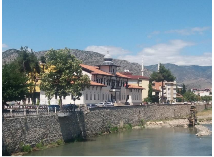
[Saraydüzü Kışla Binası ve Müzesi]

Aynı şekilde pek çok türbenin burada kendine yer bulması, Amasya'nın, Bursa misali ruhani bir şehir olmasını sağlamış. Seyyid Mir Hamza Nigarî Efendi ile ilgili verilen şu bilgi oldukça dikkate değer. Karabağ Zengezur'da doğup büyümüş, Nigar isimli bir hanımefendiden ilmi tahsil açısından destek görmüş ve bunu mahlas olarak almış, zamanla Amasya'ya gelip yerleşmiş. Burada nice ilimlerle pek çok kişiyi donatmış. Gün gelmiş, muhibbânının sayısı artınca siyaseten oradan uzaklaş(tırıl)ması uygun görülmüş. O da Harput'a yerleşmiş ve orada yürütmüş işlerini. Yaşı sekseni aşınca bölgenin valisine, cenazesinin Amasya'ya götürülmesini talep etmiş. O da uygun bir dille, Harput'tan Amasya'ya 10-12 günlük yol bulunduğunu, cenazesinin bundan zarar göreceğini dile getirmiş. 1886'da vefat eden Mir Nigarî bunun üzerine şunları söylemiş: "Seksen senedir bu vücut, Allah demiştir. O'ndan gayrısını görmemiştir. Sekiz gün içerisinde teaffün edecekse, bırak etsin!" Kendisi Muharrem ayının on üçünde vefat etmiş, on yedinci günü at arabası ile geceli gündüzlü yol alınarak yedi günde Amasya'ya ulaşılmış. Tabutta koruyucu hiçbir önlem olmadığı halde vücudunda herhangi bir bozulma olmamış hatta; "etrafi hoş bir nisbet-i Muhammediye kokusunun kapladığı müşahede edilmiştir." Benzer bir hikaye, Pir İlyas ile ilgilidir. Şöyle ki: