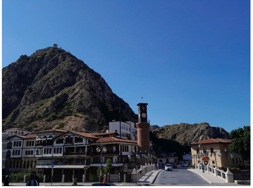
[Saat Kulesi, Hükümet Köprüsü, Valilik Binası, Öğretmenevi ve Amasya Kalesi]