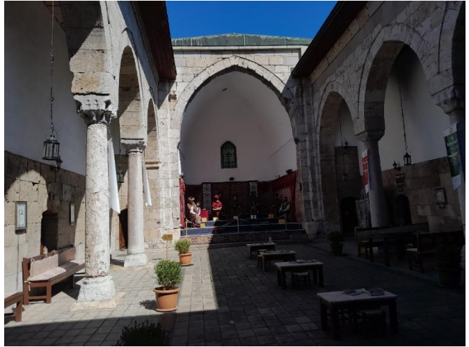
[Çeşitli ameliyatlara, tıp derslerinin, musiki ile terapinin yapıldığı iç mekan]

Sabuncuoğlu, Mücerreb-nâme 'sini Türkçe olarak kaleme almış. Kendisi bir bitki bilimci (farmakolog), çeşitli hastalıkların tedavisi ile ilgili o döneme özgü tıp aletleri açısından oradaki müze ne kadar da zengin. Bimarhane kapısında şu bilgiler yazılıdır: