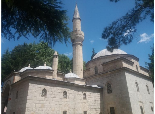
[Mehmet Paşa Camii]

Medreselerin çokluğu buranın büyük bir ilim diyarı olduğunu gösterir. Özellikle Sultan II. Bayezit külliyesi, tuttuğu yer itibarıyla şehrin merkezinde cazibe merkezi haline gelmiştir. Orada hayatın bütün kılcal damarlarına uzanan her türlü unsuru bulmak mümkündür. Merkezinde büyük ve harika bir cami, yanı başında bir medrese, çarşı, hazire, türbe ve muvakkithane ile kendi başına küçük bir şehri andırır. Hayat ve ölüm orada, bengisu güzelliğinde ırmak kenarında, yeşillikler içinde canlılığını hep korur. Selçuk Mülayim'in dikkat ettiği üzere Osmanlı'da evler, hayatın faniliğine nispetle genelde ahşap iken dini yapılar bekayı temsilen taş yapıya bürünmüştür. Dini yapılar mimari açıdan da yapı unsurlarının merkezinde ve büyük görünüştedir. Büyükağa/Kapığağası Medresesi, Sultan II. Bayezid'in kapı ağası Hüseyin Ağa tarafından 1489'da yaptırılmış. Sekizgen planlı medresenin ortasında bir havuz yer alır. 1939 depreminde hasar görmüş ve Vakıflarca tamir edilmiş. Günümüzde Kur'an kursu olarak