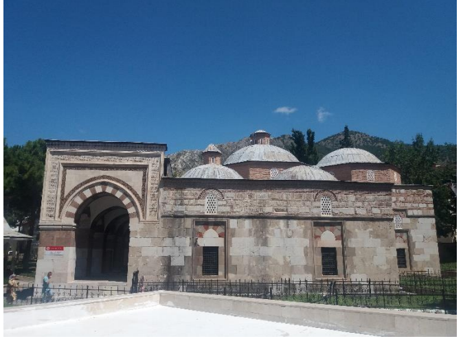
[Bayezid Paşa Camii]