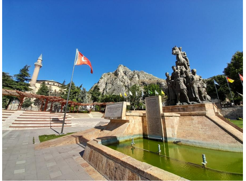
[Amasya Tamimi anıtı]

En iyisi Amasya'yı bir bilenle gezmek gerek. Amasya küçük bir yer, bir iki günde gezilebilir kanısının, orayı gezip gördükten sonra ne kadar yanıltıcı olduğu hemen anlaşılır. Kalesi, kral mezarları, eski Türk evlerine dair mimarinin binbir çeşiti, Amasya içindeki tarihi köprüler, muhteşem damak tatları, her biri farklı alanda bizi tarihe götüren müzeleri, siyaset ve din (tasavvuf) adamlarının türbeleri, geleneksel el sanatları, cami-tekke-dergah gibi dini yapıları, çeşmeleri ve hamamları, bedesten ve çarşıları ile bütünlük arzeden şehir, hayatın bütün dokusunu ve güzelliklerini bünyesinde barındırır. Böyle bir şehirde doğup büyüyen kişinin sanatkâr ruhlu olmasını tabii karşılamak gerekir. Burada yaşayanlar, tıpkı Bursa, İstanbul, Edirne misali, başka yerlere gittiklerinde burayı büyük bir hasretle özlerler sanırım. Böyle bir şehir için nice şairlerin yazıldığını ve bunların bestelendiğini biliyoruz. Çağdaş bir şairin dizeleri şu şekildedir: