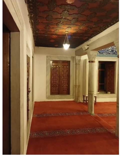
[Vâlîde-i Atîk Camii içi, sol taraf cemaat yeri]